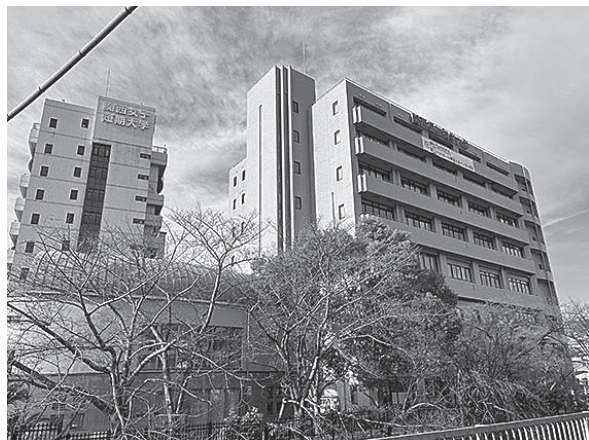
写真1 福祉栄養学科のある大学2号館